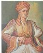
Πανοουργιάς με «σερβέτα»