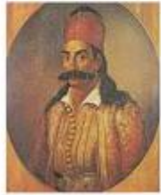
Καρδισιάνης με τουρλωτό κόκκινο «φέσι»