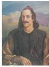
Γκούρας και Κολοκοτρώνης με μικρό «ανοιχτό φέσι»