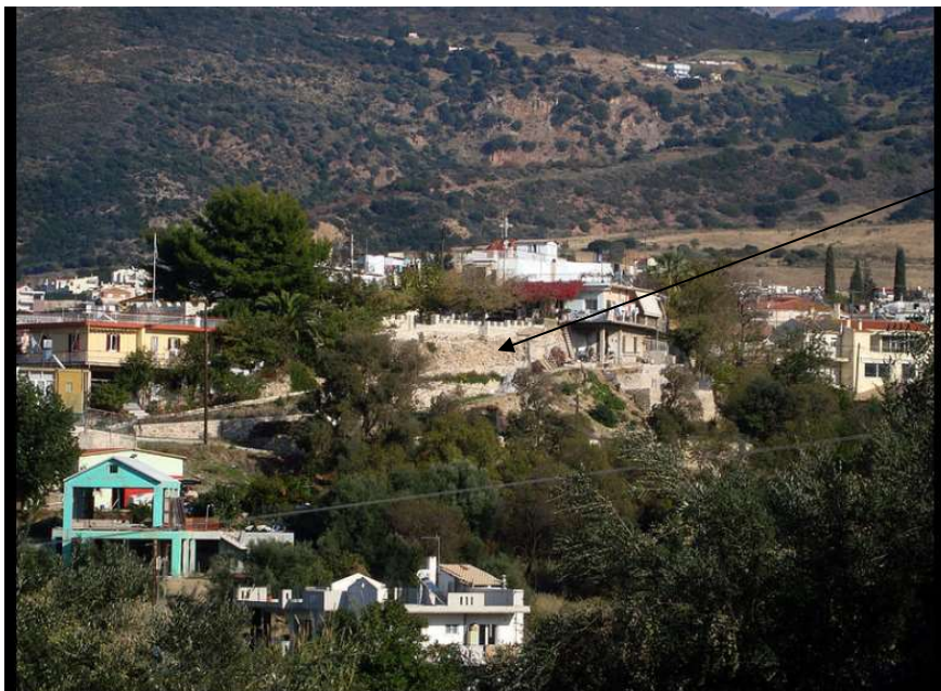
Το τοίχιο του κάστρου που διασώζεται σήμερα.

Το Κάστρο του Σαραβαλίου ήταν μικρό φρούριο στην σημερινή Αχαΐα πολύ κοντά στην Πάτρα στο χωριό Σαραβάλι. Σήμερα είναι εντελώς κατεστραμμένο στο κέντρο του χωριού, όπου διασώζεται κάποιο τείχος που λέγεται ότι τμήμα του είναι από το κάστρο. Μάλιστα πάνω στη θέση του κάστρου έχουν χτιστεί κατοικίες και έχει μειωθεί το αρχικό ύψος του λόφου κατά 10 μέτρα. Στην θέση του βρίσκεται διαμορφωμένη η κεντρική πλατεία του Σαραβαλίου.