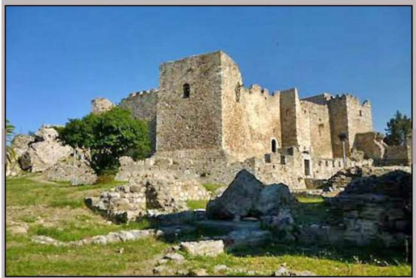
Κάστρο της Πάτρας

Αρκετά είναι τα κάστρα στον νομό Αχαΐας. Ανάμεσά τους βρίσκονται τα: Αιγυπτόκαστρο, κάστρο του Δοξαπατρή, κάστρο Δροσιάς, κάστρο Δάσους, κάστρο Καλαβρύτων ή κάστρο της Ωριάς, Ακρόπολη της Πάτρας, κάστρο της Πάτρας, παυλόκαστρο, Πουρναρόκαστρο, κάστρο του Ρίου, κάστρο Σαλμενίκου, κάστρο Σανταμερίου, κάστρο της Χαλανδρίτσας, Τείχος Δυμαίων, Σιδηρόκαστρο, Σαραβάλι κ. ά.