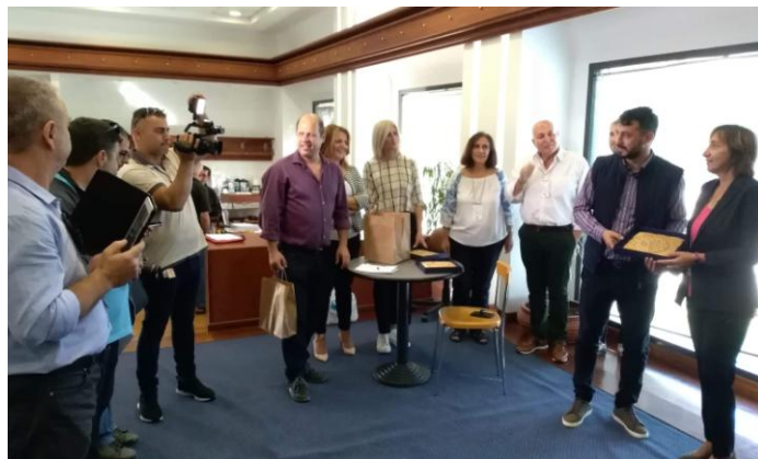
Ηεπίσκεψή μας στο Δημαρχείο του Δήμου Ήλιδας στην Αμαλιάδα καλύφθηκε σε ρεπορταζ και από το τηλεοπτικό κανάλι OPT

Επισκεφθήκαμε όμως εκτός από την Αμαλιάδα και την πόλη του Πύργου, όπου την Τετάρτη 23 Οκτωβρίου 2019 ξεναγηθήκαμε στο Αρχαιολογικό Μουσείο Πύργου, το κτήμα Μερκούρη , και τέλος με ειδική άδεια από το Πολεμικό Ναυτικό στον Φάρο του Κατακόλου.