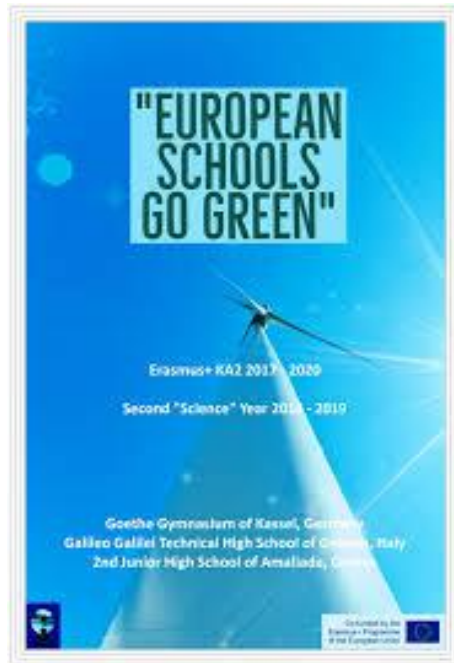
το εξώφυλλο του τελευταίου ψηφιακού μας περιοδικού

Δεν πρόλαβαν να ανοίξουν τα σχολεία και ξεκινήσαμε με ενθουσιασμό. Από τον Αύγουστο ήδη η παιδαγωγική ομάδα των εκπαιδευτικών προετοίμασε την φιλοξενία των εταίρων μας για τον Οκτώβριο. Επίσης δημοσιεύτηκε το ψηφιακό μας περιοδικό με την παρουσίαση εργασιών και προϊόντων και των τριών σχολείων της δεύτερης χρονιάς «Science Year» 2018-2019.