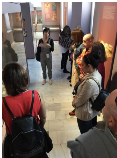
Στο Αρχαιολογικό Μουσείο του Πύργου

Επισκεφθήκαμε όμως εκτός από την Αμαλιάδα και την πόλη του Πύργου, όπου την Τετάρτη 23 Οκτωβρίου 2019 ξεναγηθήκαμε στο Αρχαιολογικό Μουσείο Πύργου, το κτήμα Μερκούρη , και τέλος με ειδική άδεια από το Πολεμικό Ναυτικό στον Φάρο του Κατακόλου.