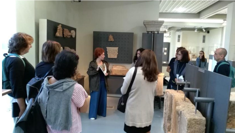
Αρχαιολογικό Μουσείο Αρχαίας Ήλιδας

Επίσης στην Αρχαία Ήλιδα το πρωί της Πέμπτης 24 Οκτωβρίου 2019 απολαύσαμε όλοι τον υπέροχο χώρο και Μουσείο με την ξενάγηση από την υπεύθυνη αρχαιολόγο κ. Παναγοδήμου.