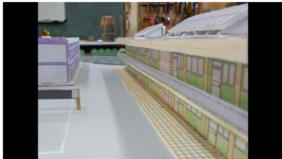
(Η ομάδα Erasmus εν ώρα εργασίας μετά το τέλος του σχολικού ωραρίου, το σχολείο μας και η μία μακέτα από την ίδια οπτική γωνία!)