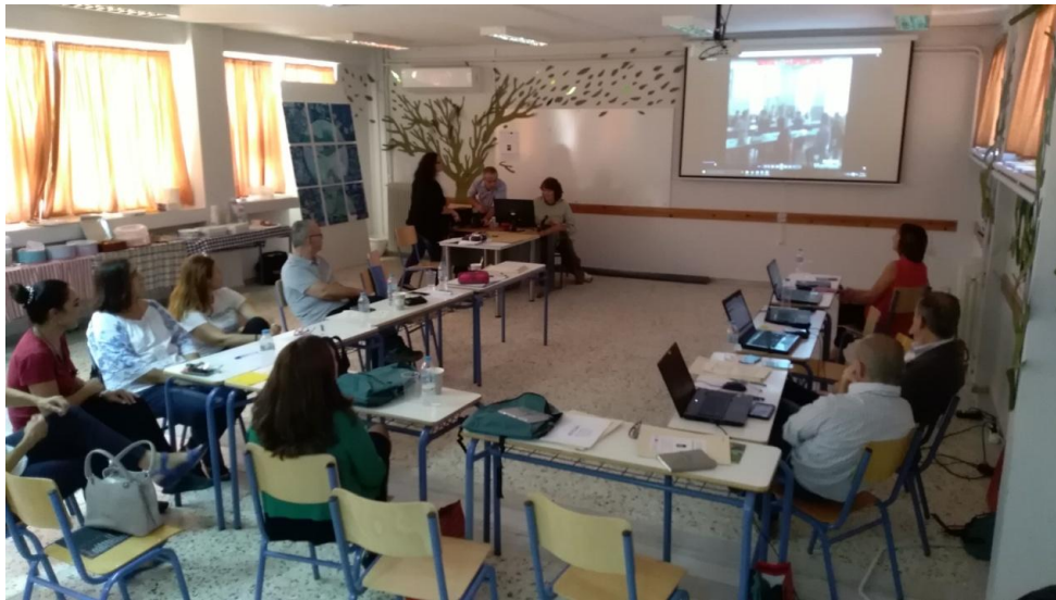
Ο χώρος εργασίας της συνάντησης, η αίθουσα Erasmus του σχολείου μας