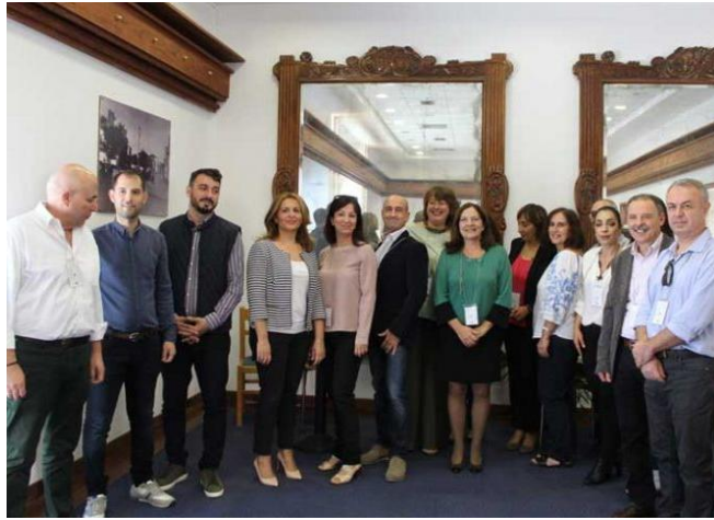
ΗΕλληνική και Ιταλική αντιπροσωπεία μαζί με τους εκπροσώπους του Δήμου Ήλιδας