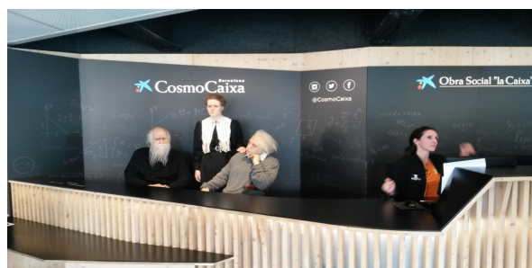
Cosmocaixa Science Museum

Στη συνέχεια επισκεφτήκαμε το Μουσείο επιστημών Cosmocaixa. Η CosmoCaixa προσφέρει στους επισκέπτες της μια πληθώρα δραστηριοτήτων και μόνιμων & προσωρινών εκθέσεων για να δώσει σε όσους ενδιαφέρονται για μια μεγαλύτερη εικόνα στον κόσμο της επιστήμης. Το κτίριο του μουσείου είναι εξίσου