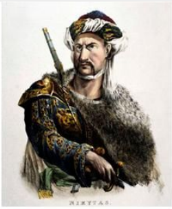
Νικηταράς και Μακρυγιάννης με «πόσι»