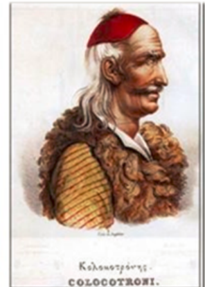
Γκούρας και Κολοκοτρώνης με μικρό «κοφτό φέσι»