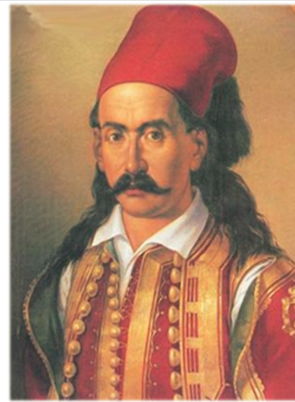
Ο Μάρκος Μπότσαρης με τουρλωτό φέσι.

https://nhmuseum.gr/tmimata/mesa-stis-syloges-tou-mouseiou/item/3379-prosopografiagunaikasmefisipoukamisokaibeloudinochrusokentitogilekoelaiografiaseostrako ]