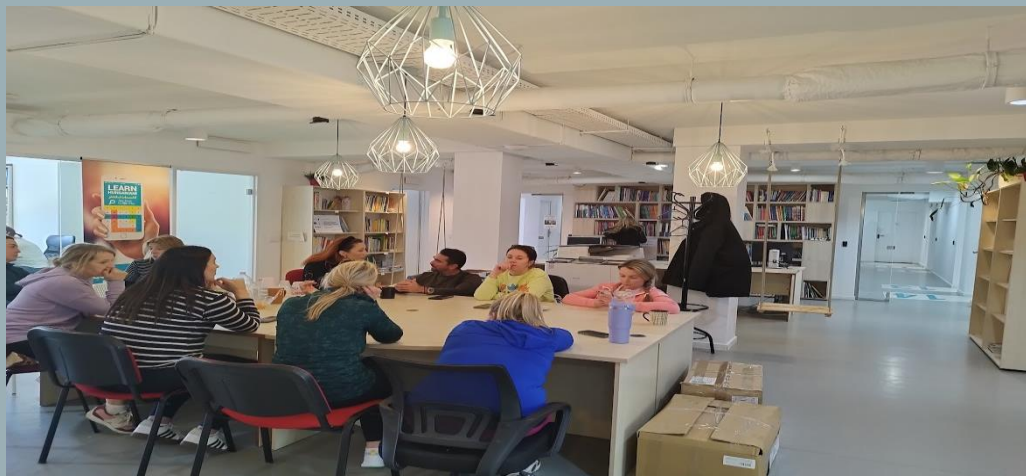
Εικόνες από το σεμινάριο στην Βουδαπέστη